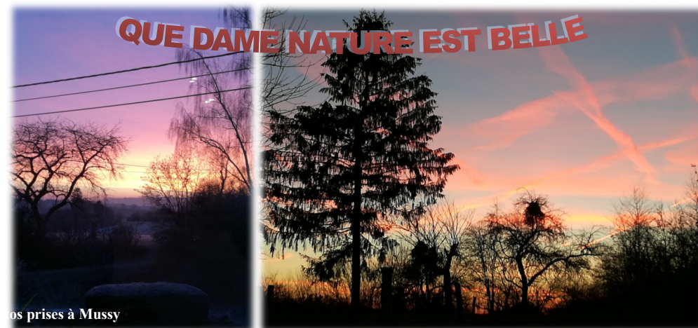
os prises à Mussy