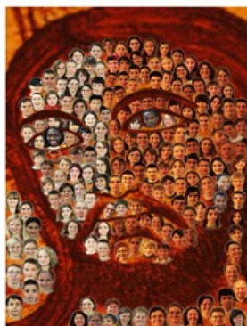
Mouvement Chrétien des Retraités - Vie Montante Belgique Francophone - Suisse Romande 2019- 2020