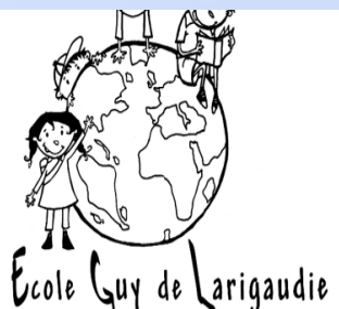
Ecole Guy de Larigaudie

Le nouveau site de l'école est opérationnel depuis quelques mois. Si vous y trouvez les infos utiles sur l'école et ses divers comités, vous y trouverez aussi la chronique du directeur qui paraît tous les 15 jours. Ces chroniques expliquent les rôles, les idées, les réflexions et les coups de gueule (il en faut parfois). Chaque chronique est archivée et donc vous pouvez suivre l'évolution.